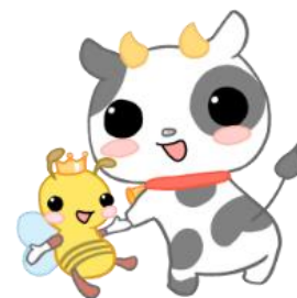
八王子盲学校キャラクター ハッチ&モーちゃん