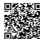
入学相談関係ページ

説明会の内容は第1回説明会とほぼ同じですので、第1回説明会に参加された方は授業見学（9：50～受付）からの参加も可能です。