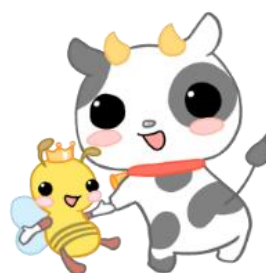
八王子盲学校キャラクター ハッチ&モーちゃん