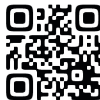
第2回普通科説明会申込